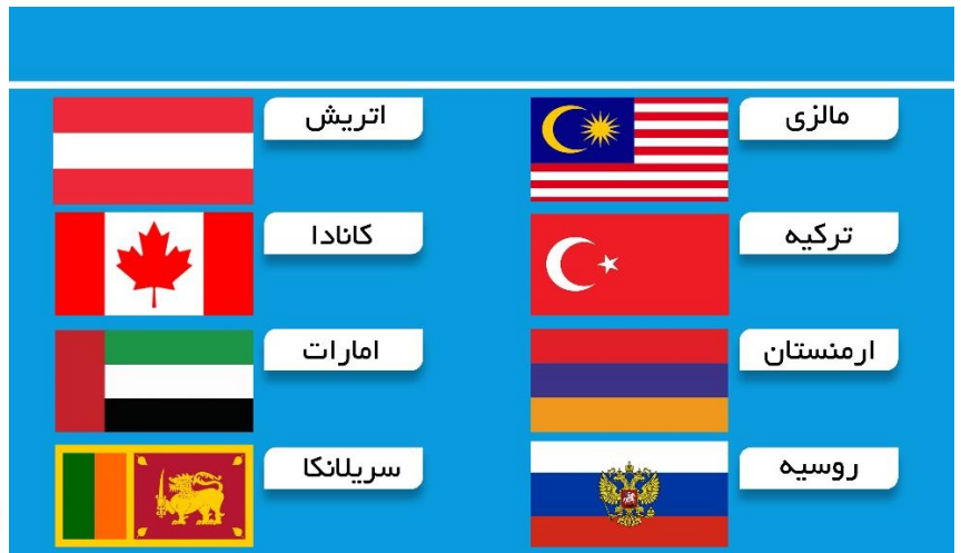
↑ شعب خارجی