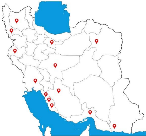
↑ شعب و نمایندگی‌های داخلی